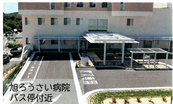
旭ろうさい病院 バス停付近

これまでは病院から離れた位置にある「旭労災病院」バス停が最寄りのバス停でしたが、バス停の設置により、より便利に病院をご利用いただけるようになります。