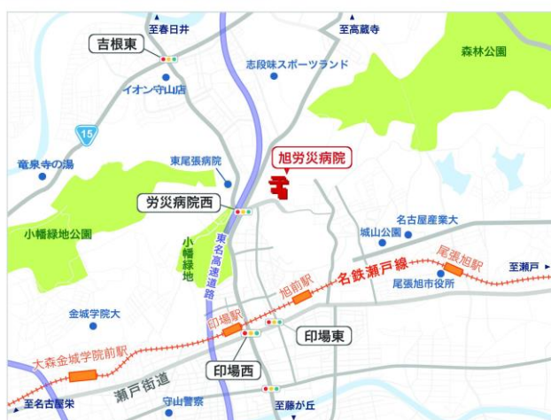
旭労災病院 アクセスマップ